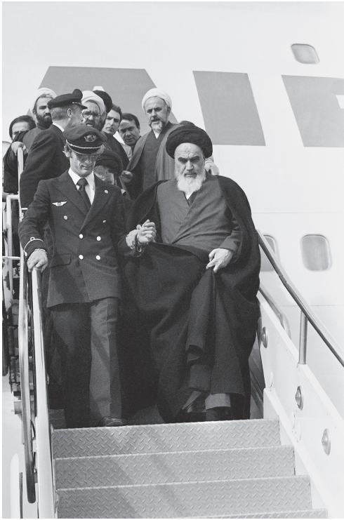
Ayatollah Ruhollah Khomeini bei seiner Rückkehr in den Iran am 1. Februar 1979.

Kurz zuvor hatte der letzte Schah das Land verlassen. Khomeinis Fundamentalisten gewannen rasch die Oberhand in der Revolution, und am 1. April wurde die Islamische Republik Iran ausgerufen.