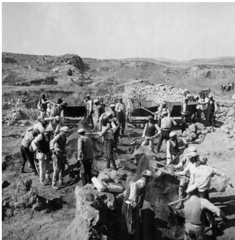
Abb. 6: Die Grabungen auf Büyükçale in den frühen 1950er Jahren

zeitig stellt die Zusammenarbeit Hugo Winklers mit dem Kaiserlichen Osmanischen Museum vertreten durch Theodor Makridi die erste Kooperation zwischen deutschen und türkischen Wissenschaftlern dar, die 1907 durch das Deutsche Archäologische Institut unterstützt wurde. Diese internationale und interdisziplinäre Gesamtkonstellation des auf die Klärung wissenschaftlicher Fragestellungen ausgerichteten Projekts war in dieser Zeit einzigartig und wegweisend.